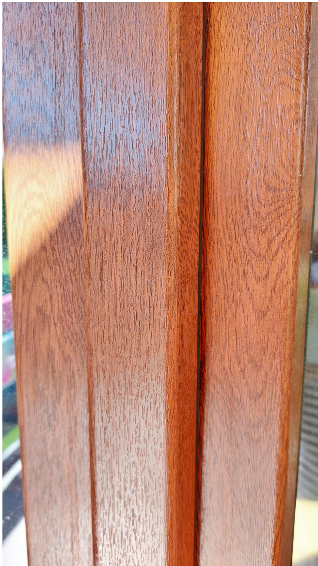
Okno v ložnici 67x179

Instalace vnějších sítí proti hmyzu na několik plastových oken a jedny balkónové dveře. Rozměry jsou orientační, nutno přeměřit. Sítě ideálně pouze ve výklopných částech oken. Podmínkou je co nejpřesnější barevné ladění, aby sítě nebyly tolik viditelné. Dekor: hnědá, asi ořech