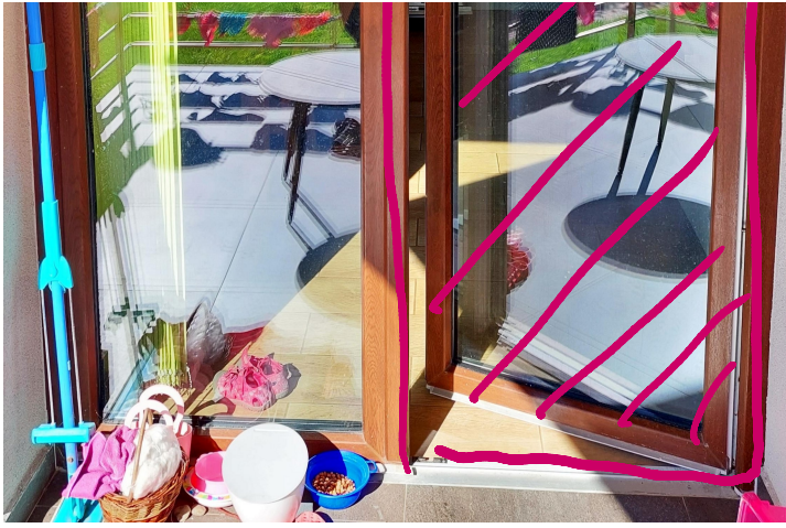
Okno WC 70x180