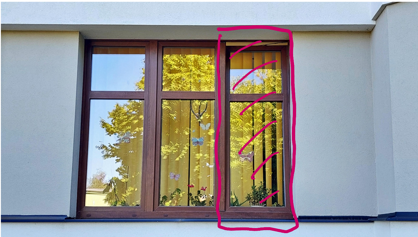
Okno v koupelně 84x112