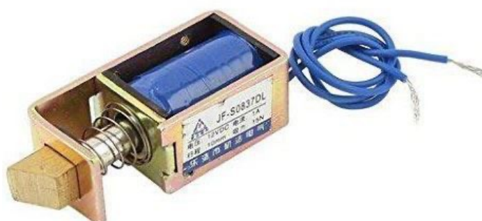
Rozměry zámečku: 54×26×20mm