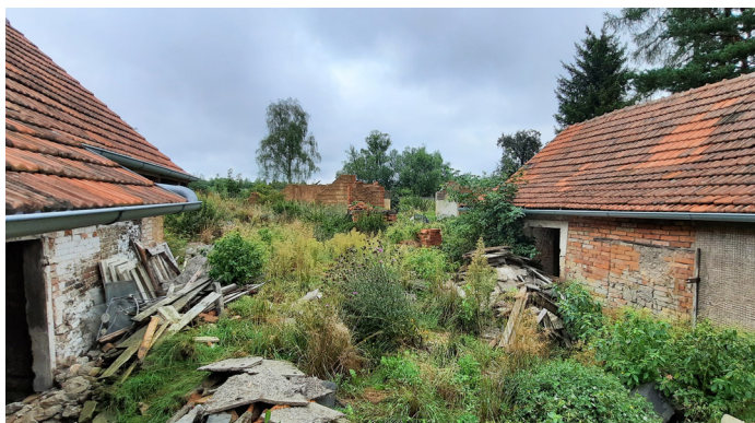
foto aktuální stav 2022