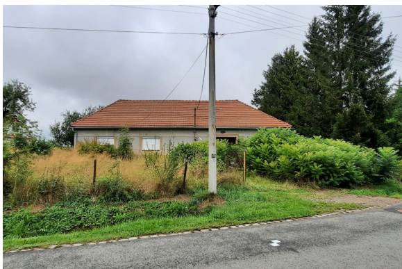
foto aktuální stav 2022