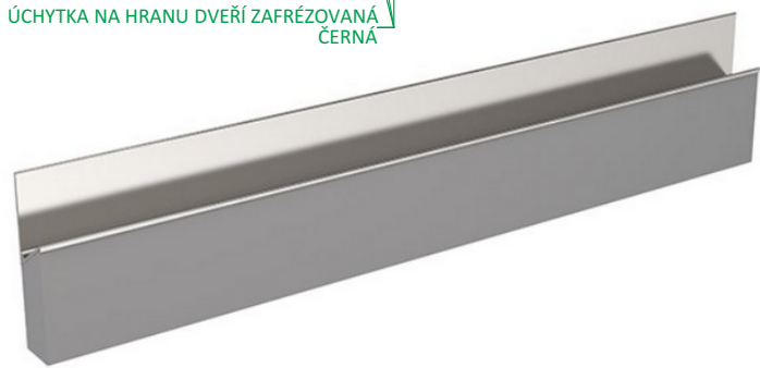
ÚCHYTKA NA HRANU DVEŘÍ ZAFRÉZOVANÁ ČERNÁ