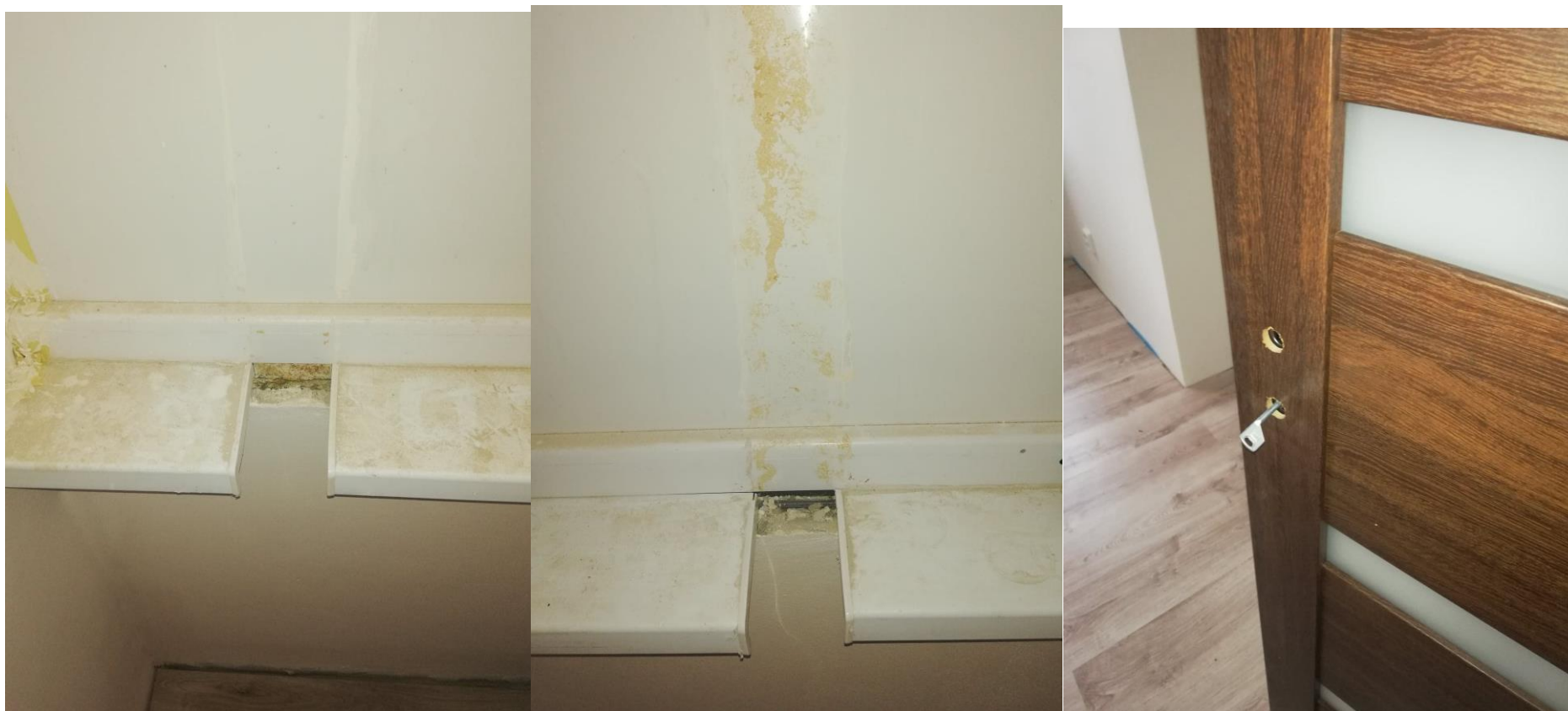
Foto první a druhé: zde byla původně příčka, kdysi se dělala nová okna i s parapety. Při rekonstrukci jsem se rozhodl příčky odstranit, vznikla tím díra, je to ve dvou místnostech. V obou případech bych parapet zařídil a zeď začistil.

Foto tři: osazení klik s kováním si dodělám případně sám.