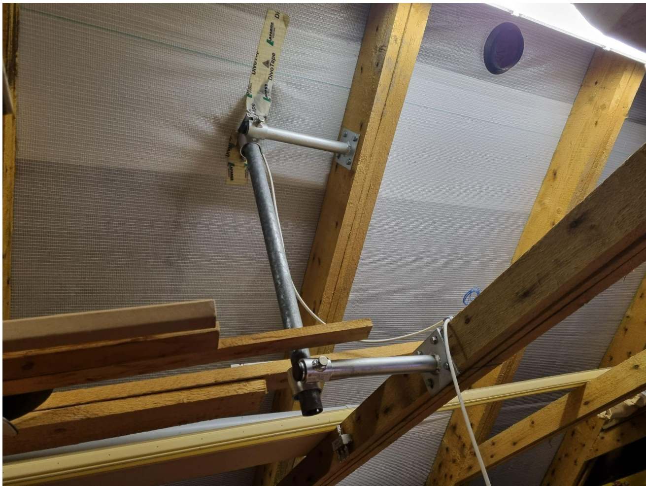
detail východní strany (zídka k trámu cca půl metru)