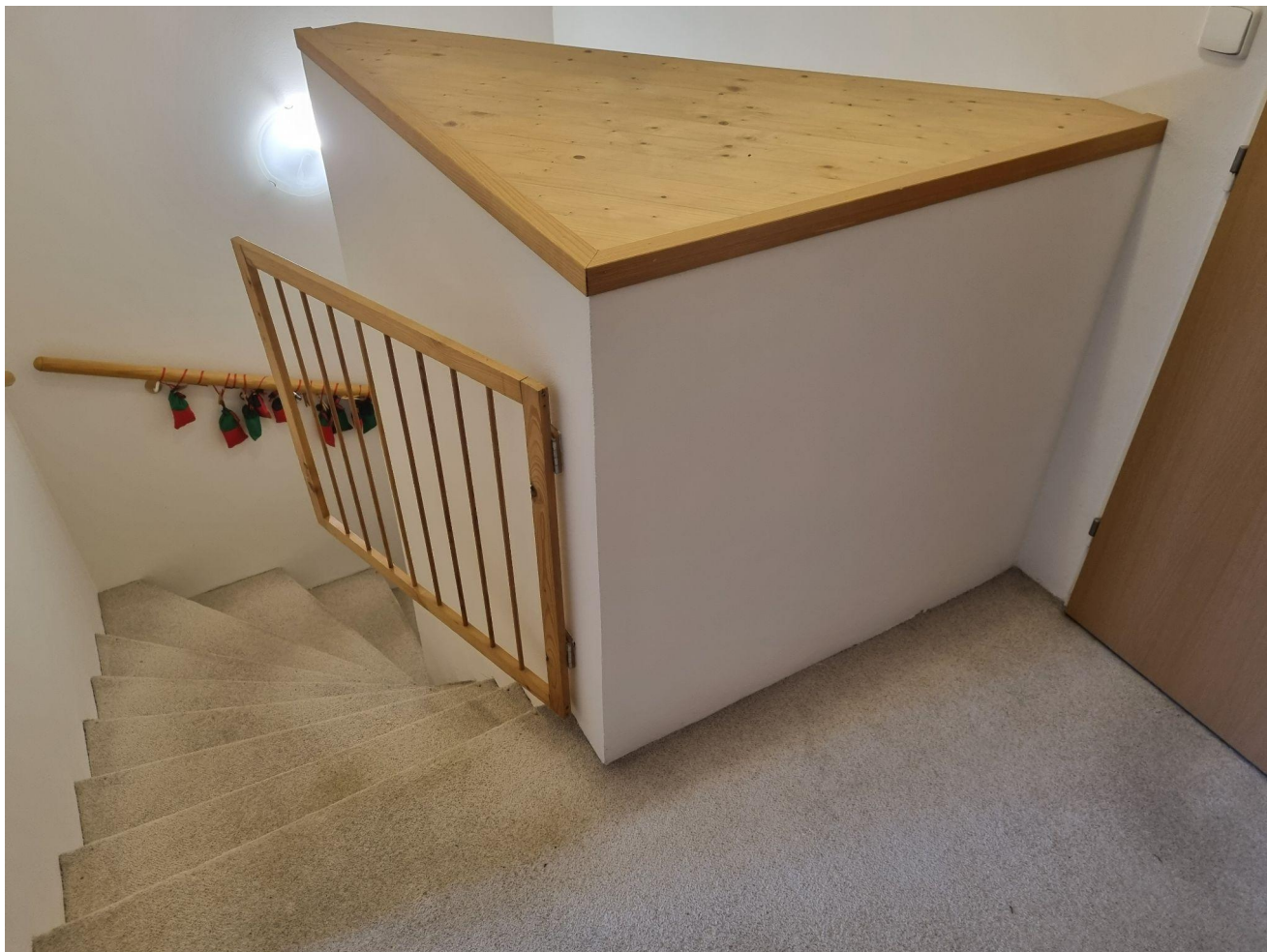
1.patro - pohled na jižní stěnu