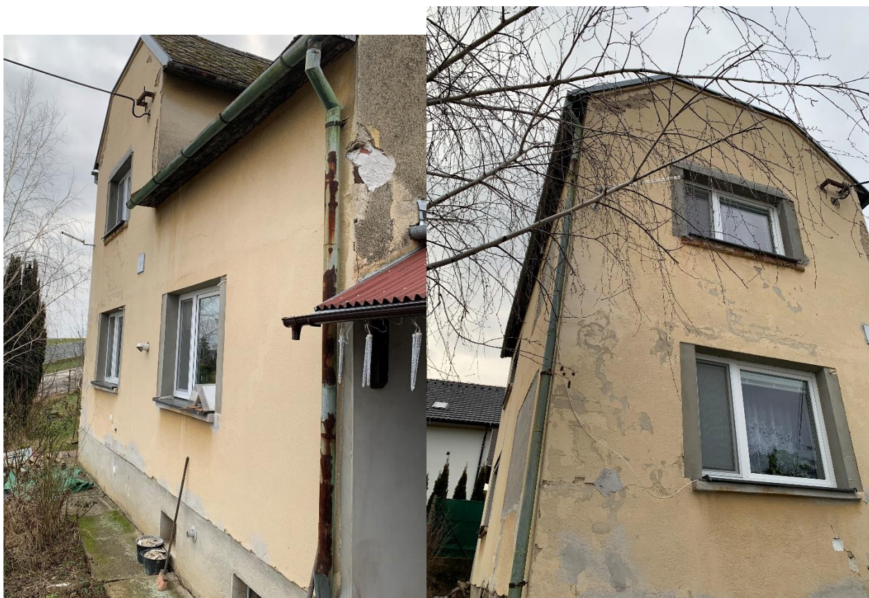
Obrázek 3 Východní pohled