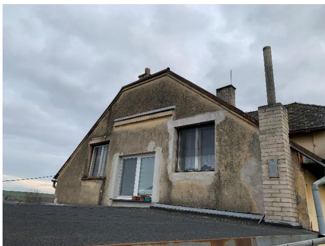
Obrázek 1 Severozápadní pohled

Do nabídky i termín a rozsah prací, délka trvání prací.