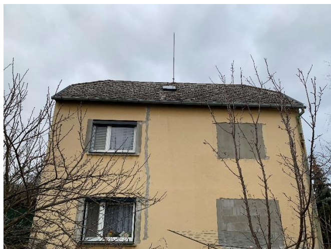
Obrázek 2 Jižní pohled