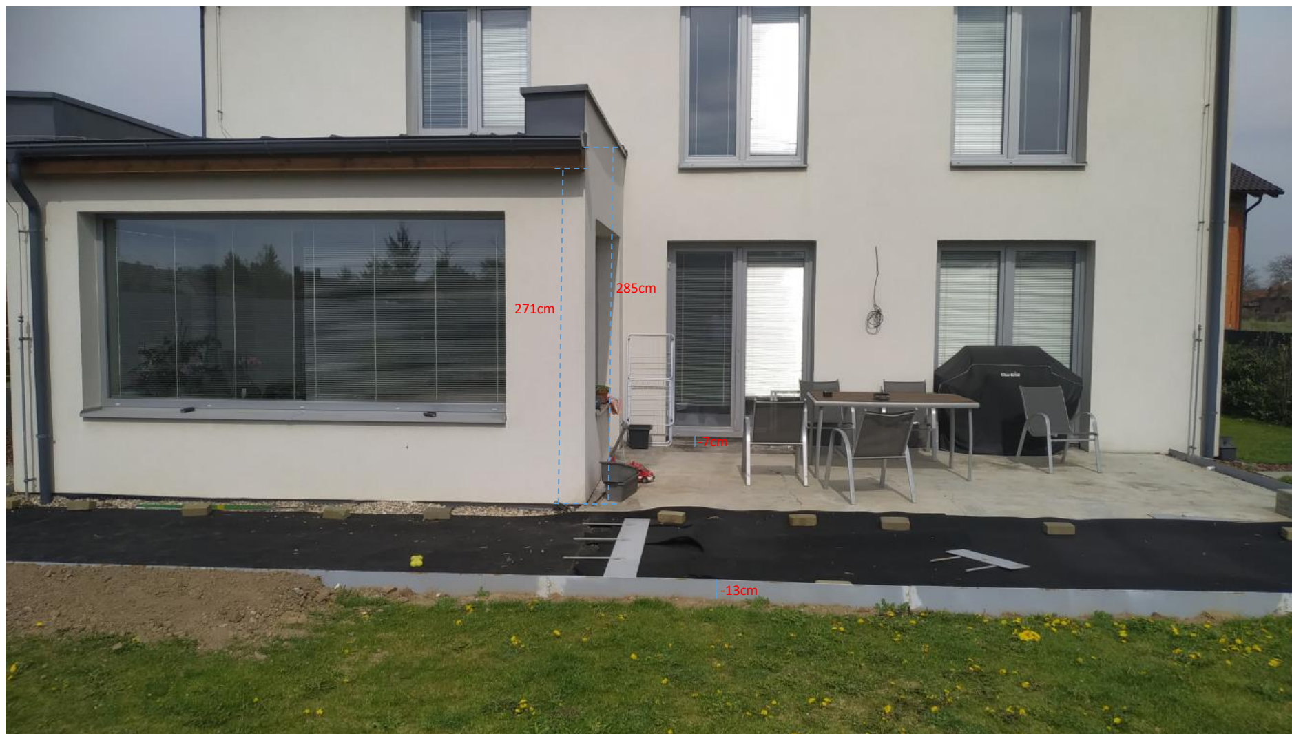
Jedná so o zděný RD z dutých tvárnic Heluz. Obvodové zdivo je vyzděno z tvárnic 44cm a je osazen zateplovací systém 10cm.