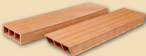
KMB HURDIS 1 rovné čelo