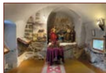
9. Kaple z 12. století