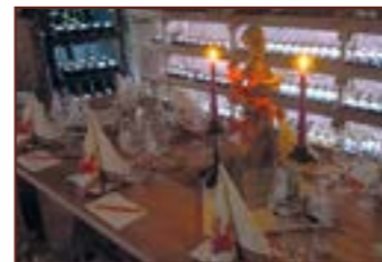
7. Vinný sklep