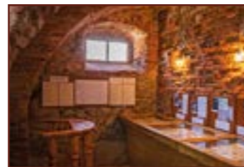
5. Muzeum soudnictví