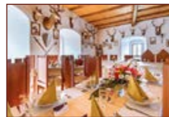
3. Královský sál