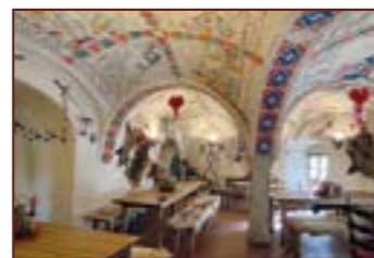
1. Středověká Hodovna