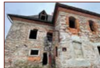
6. Hradní vězení