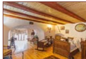
8. Historická ložnice