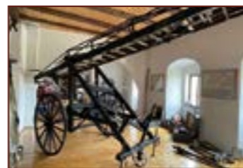
4. Hasičské muzeum