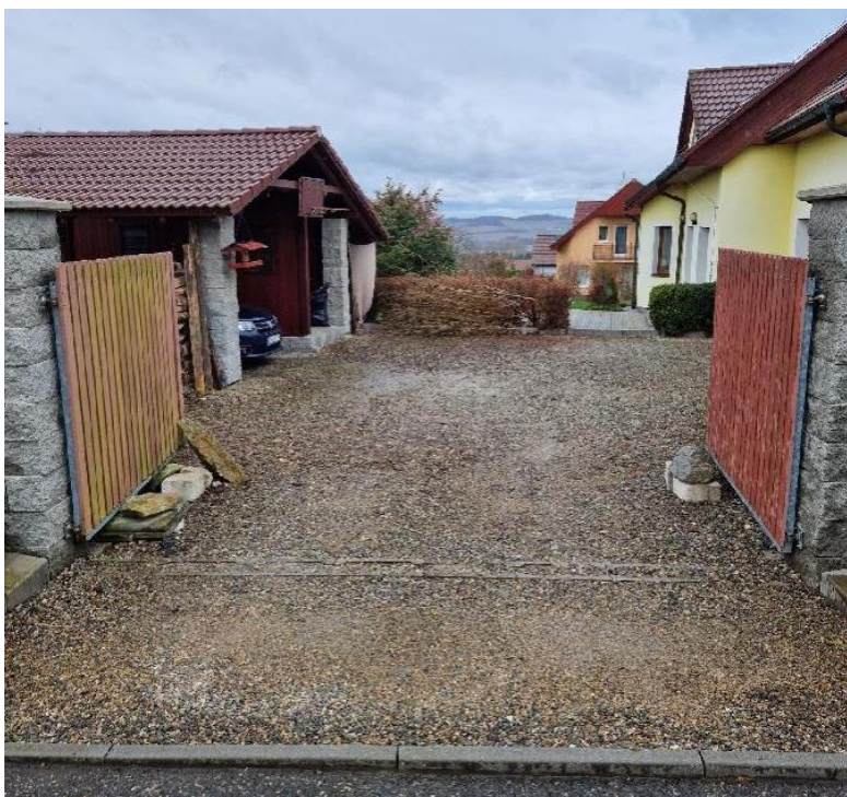
Pohled ke garáži od vjezdu