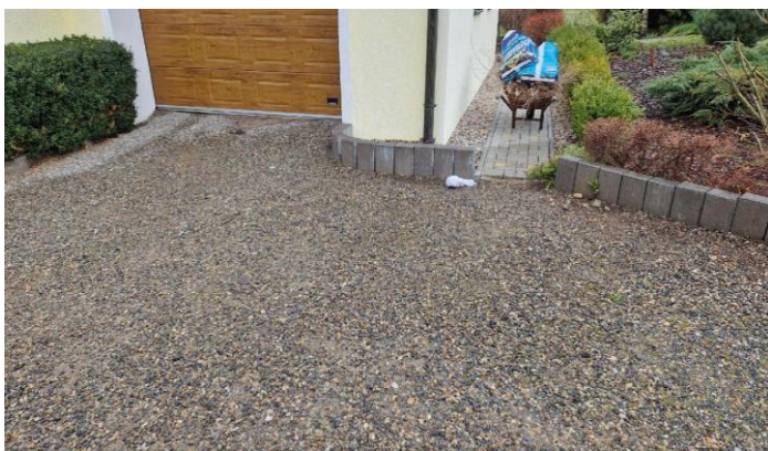
Vjezd z druhé strany – vpravo pod vraty je kanál