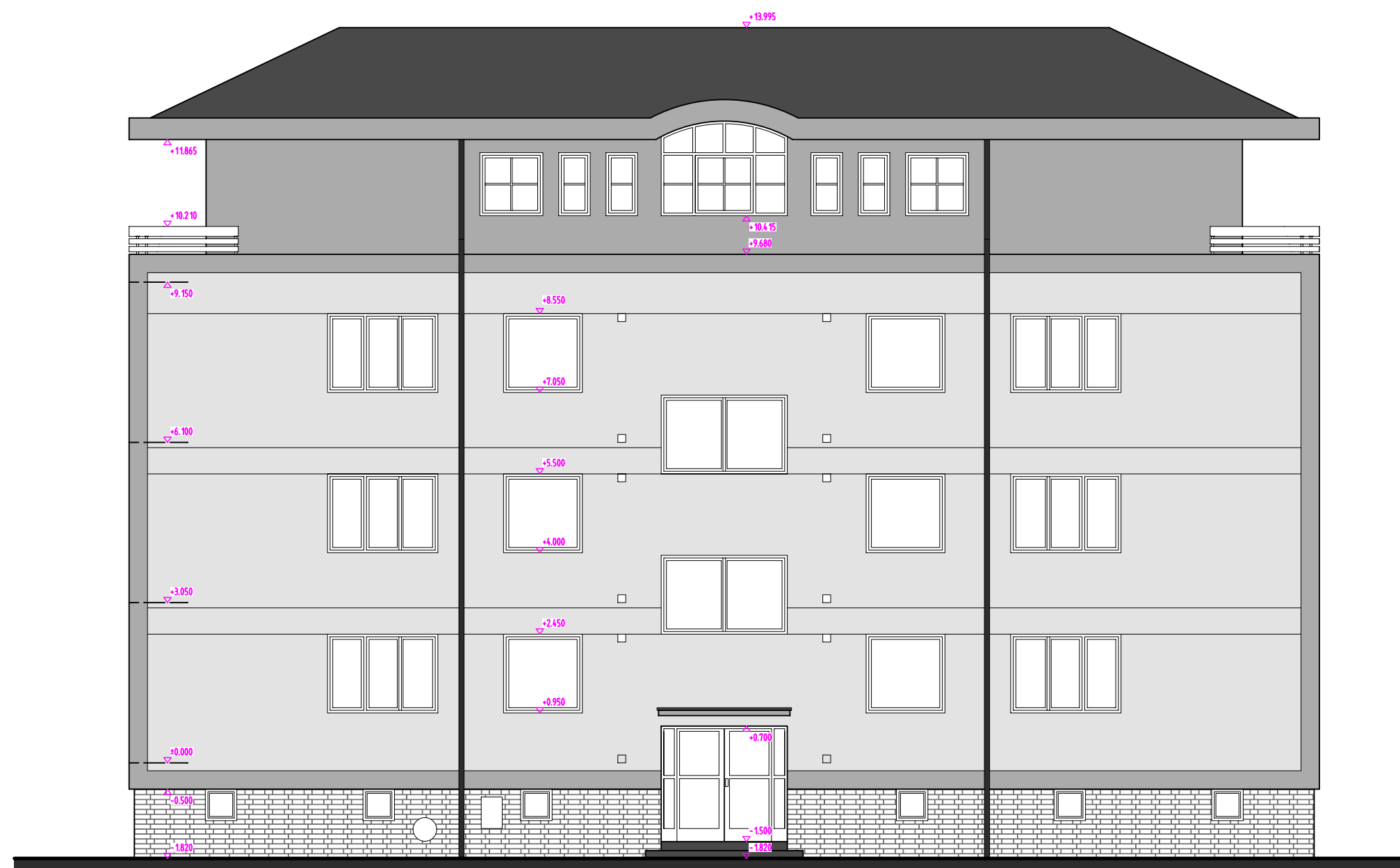
POHLED SEVEROVÝCHODNÍ - NÁVRH