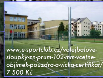
www.e-sportclub.cz/volejbalove-sloupky-zn-prum-102-mm-vcetne-objimek-pouzdra-a-vicka-certifikat/ 7 500 Kč