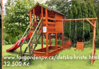
www.forgardenpv.cz/detska-hriste.html 32 500 Kč