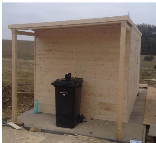
Ilustrační obrázek