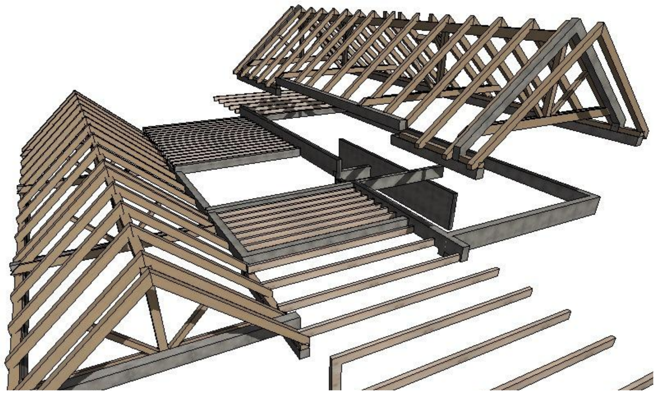
Obecná perspektiva (2)