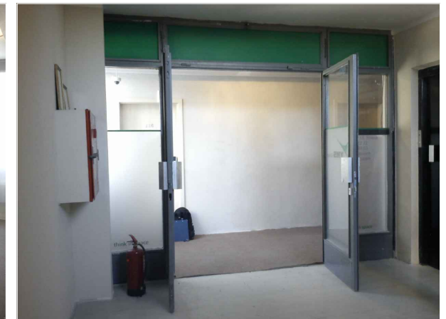
FOTO OD VÝŤAHOV