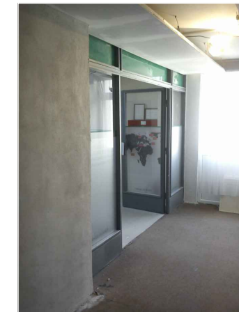
FOTO Z CHODBY