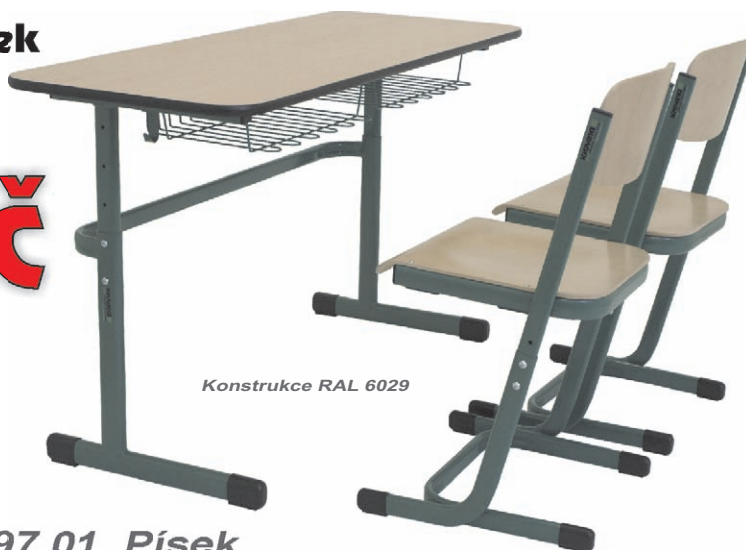
Konstrukce RAL 6029