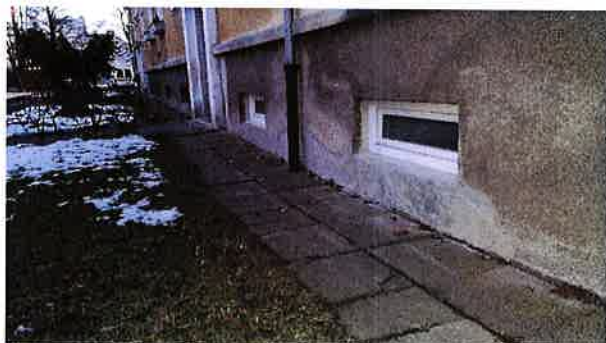
Pravá přední strana