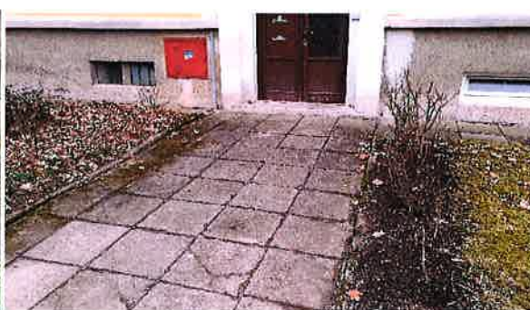
Levý a pravý vstup do budovy (přední část budovy)