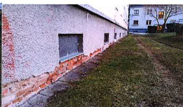
Zadní strana budovy (problémové místa ukotvení nopové folie)