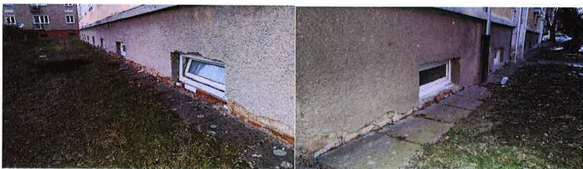
Levá zadní strana budovy s přední - směr město (problémové místa ukotvení nop.folie)