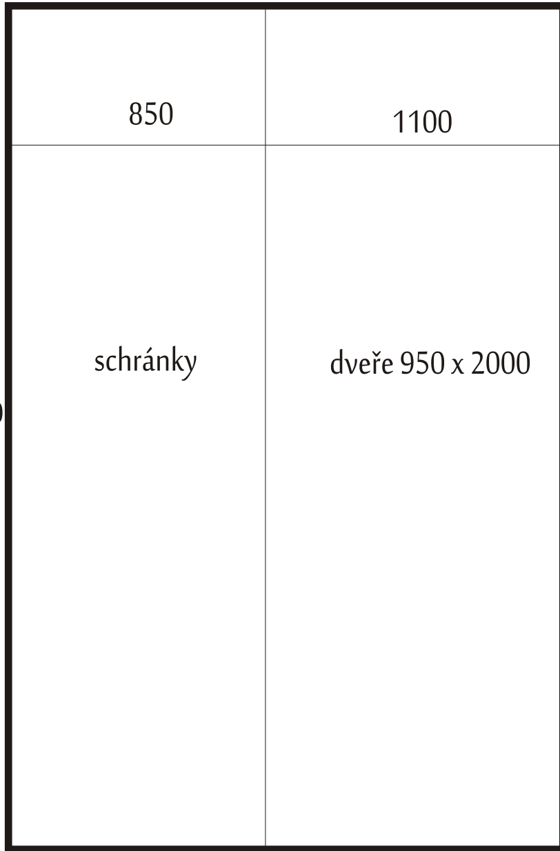
Přední vchod 1373 +1377 (5x)