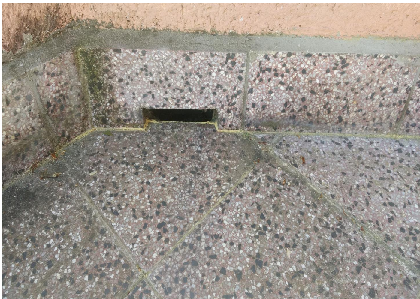
Výtok z terasy vně