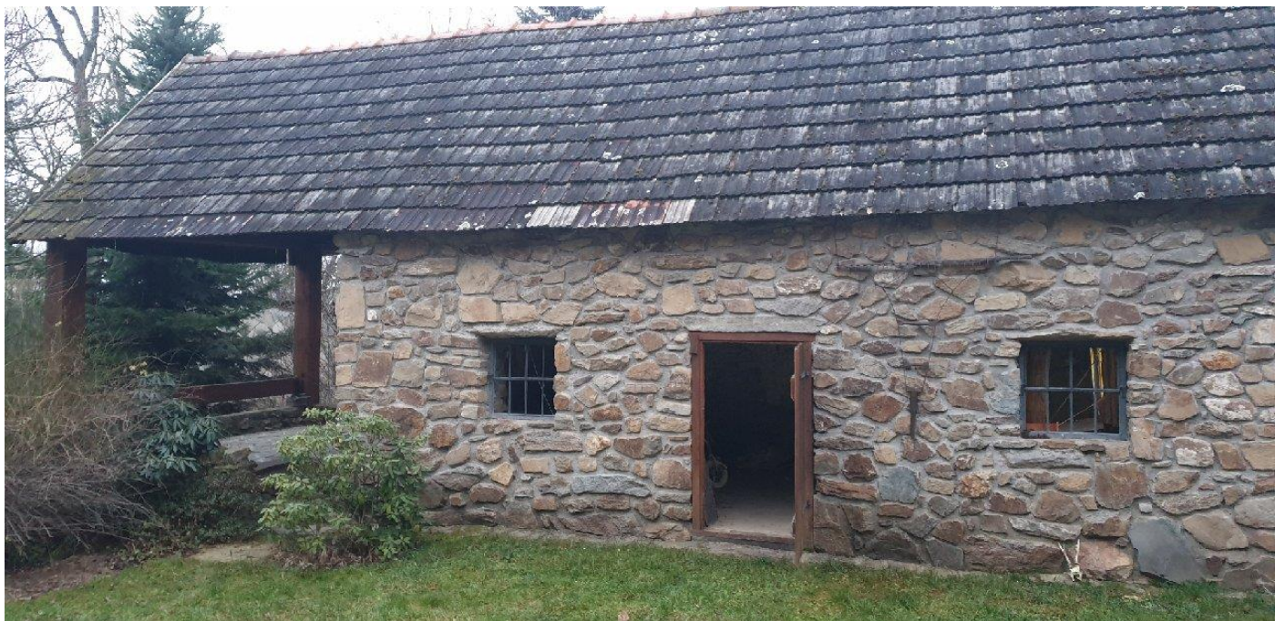
Boční pohled na domek. Realizace bude v levé části.