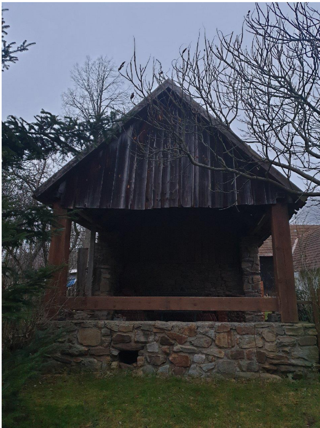
Pohled na čelo domku přes terasu. Terasa zůstane a předěl mezi terasou a obytnou částí bude řešen dveřmi a okny viz. popis.