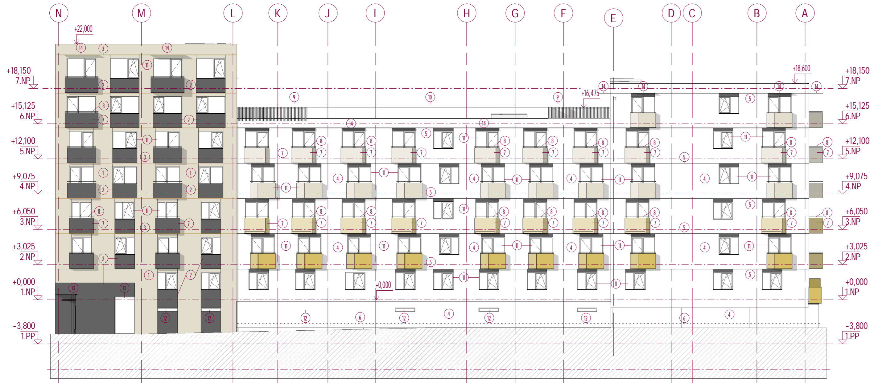
POHLED JIHOVÝCHODNÍ od ulice Reissigovy