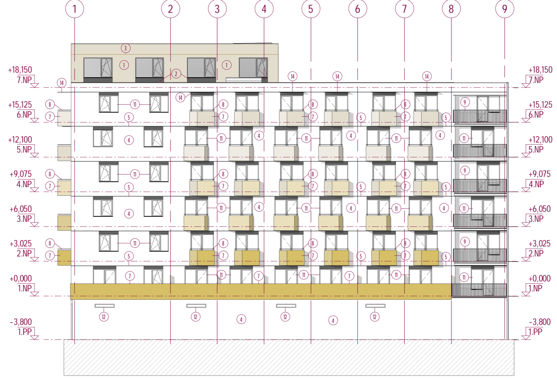
POHLED SEVEROVÝCHODNÍ od ulice Sportovní