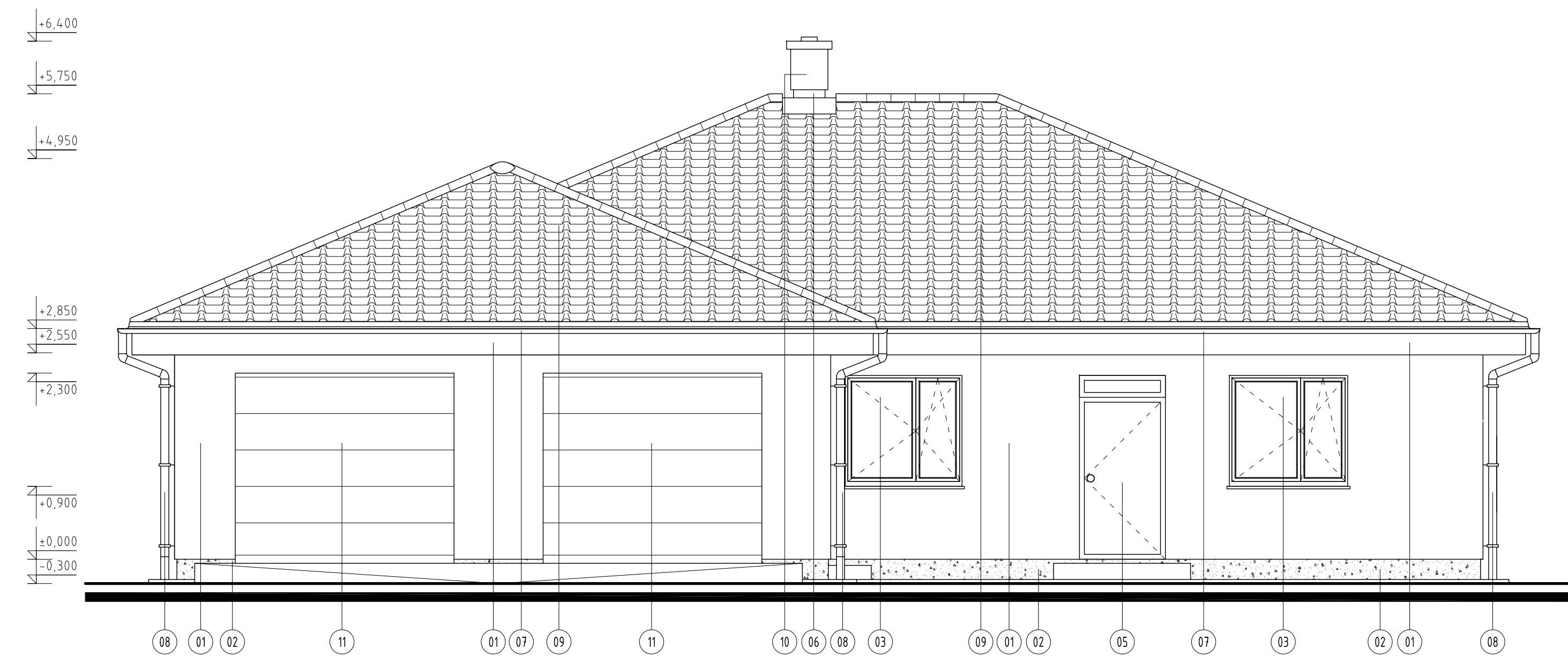
ZÁPADNÝ POHLAD M 1:50