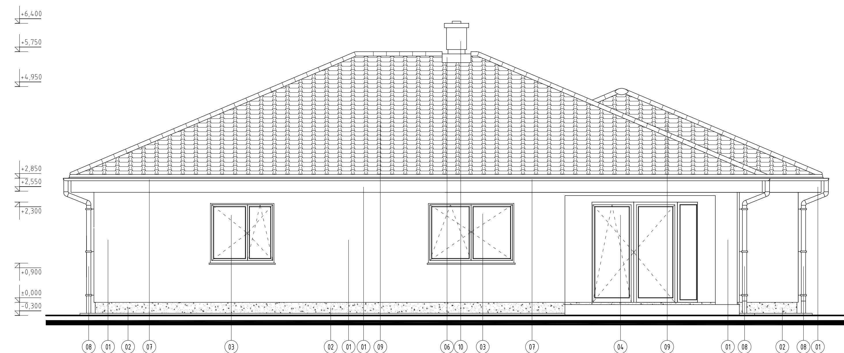
VÝCHODNÝ POHLAD M 1:50