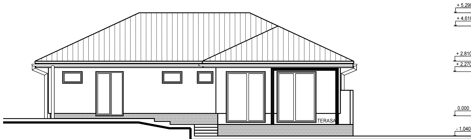
POHLAD ZADNÝ, M = 1 : 100