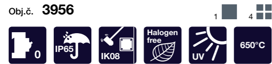
Rozvodnice AcquaCOMBI IP65