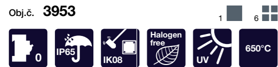
Rozvodnice AcquaCOMBI IP65