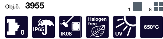
Rozvodnice AcquaCOMBI IP65