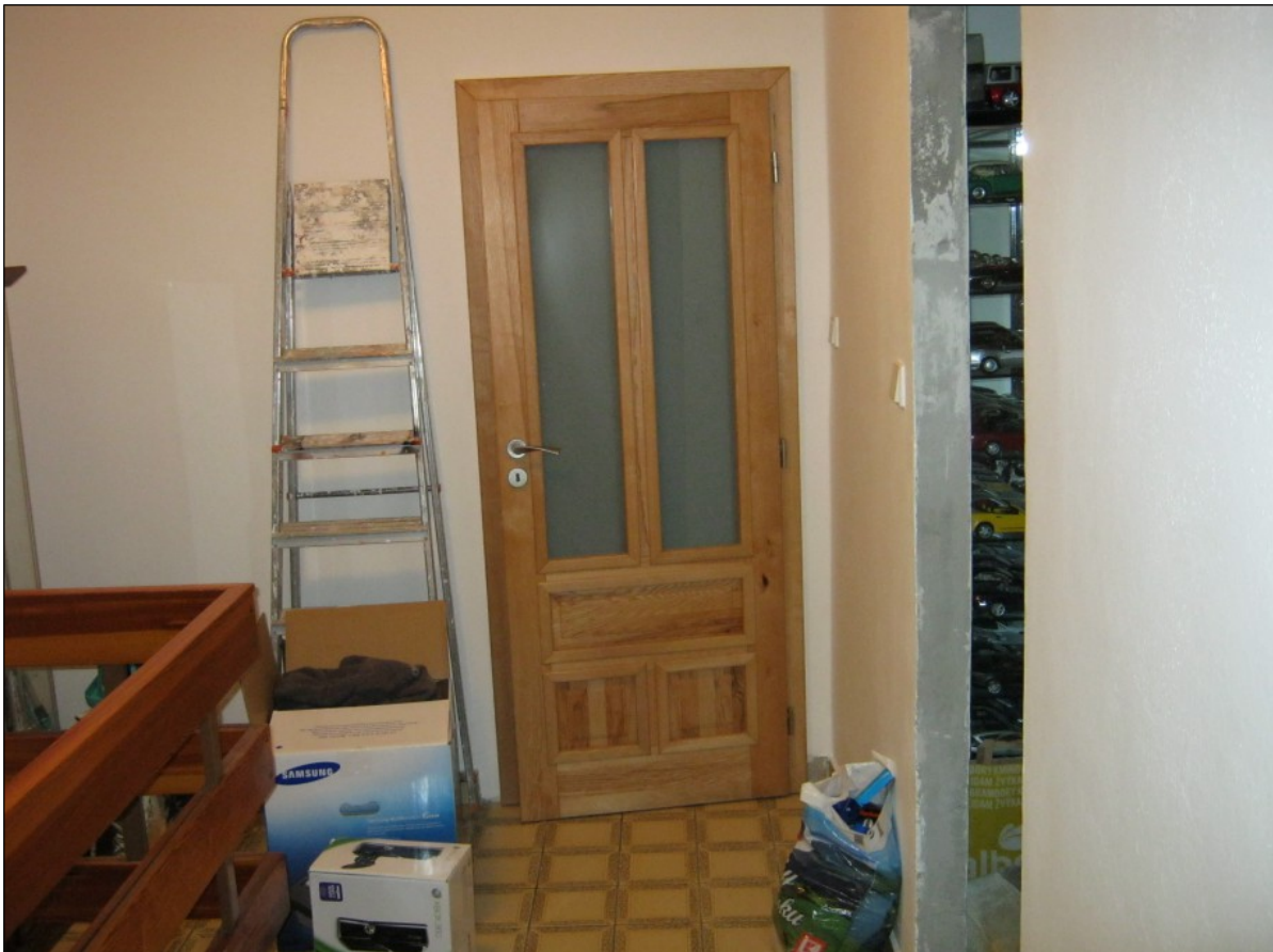
Pohled z chodby – stavební otvor